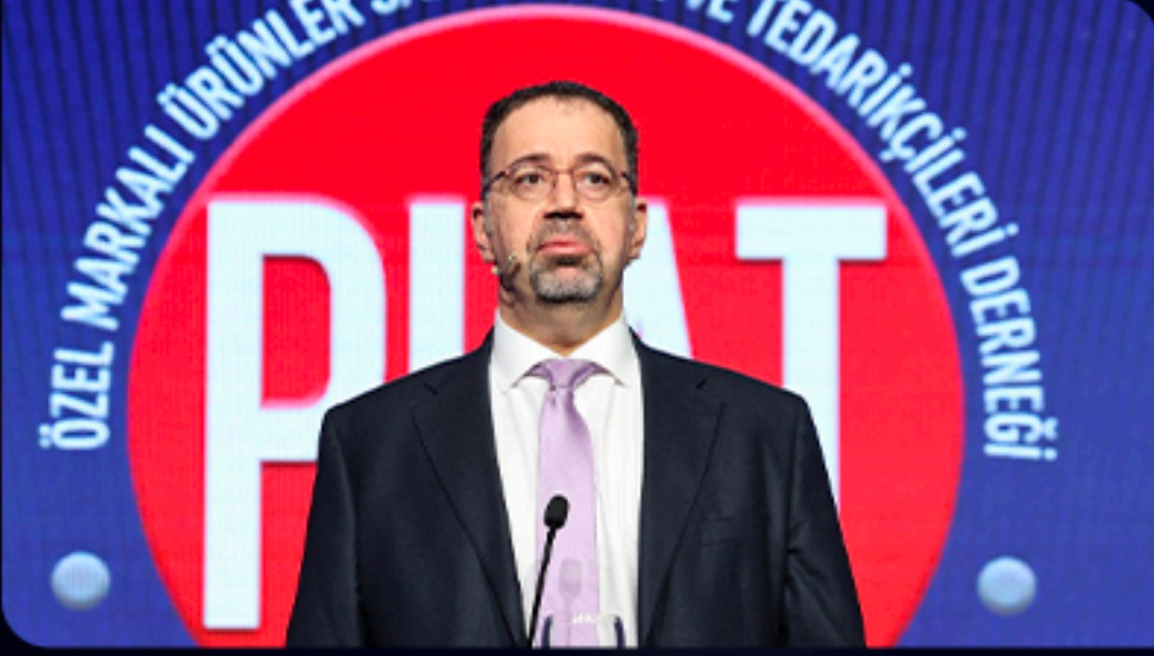
Ekonomist PROF. DR. DARON ACEMOĞLU