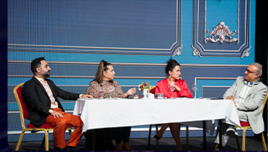
BKM MUTFAK SKEÇ EKİBİ