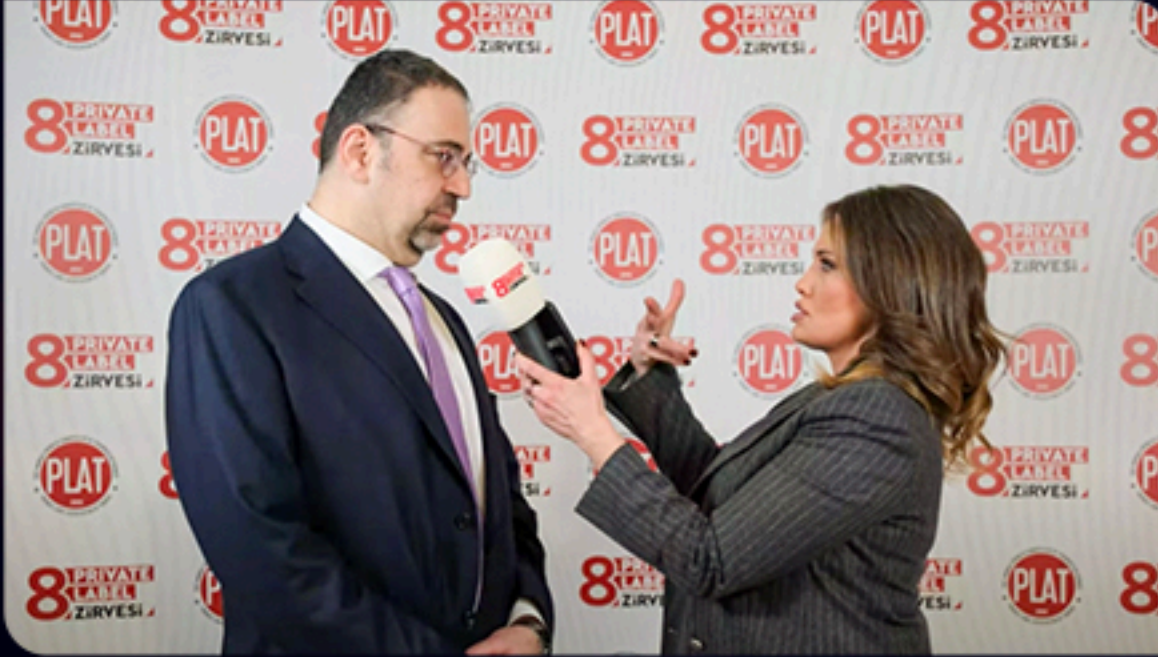
Ekonomist PROF. DR. DARON ACEMOĞLU